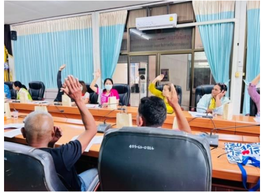
ครั้งที่ ๓