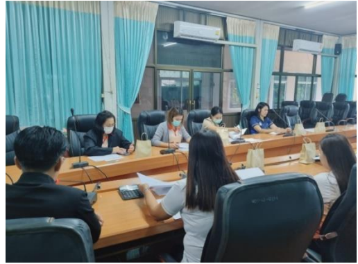
ครั้งที่ ๒