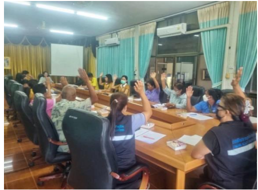
ครั้งที่ ๔