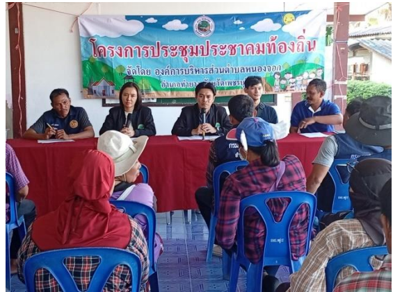
หมู่ที่ ๑๓ บ้านหนองเตาปูน