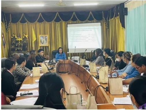
ครั้งที่ ๑

การประชุมคณะกรรมการบริหารกองทุนหลักประกันสุขภาพ (เงินสมทบกองทุนหลักประกันสุขภาพ) งบประมาณตั้งไว้ ๑๓๑,๕๐๐ บาท (แหล่งที่มา : ข้อบัญญัติงบประมาณรายจ่ายประจำปีงบประมาณ พ.ศ. ๒๕๖๘)