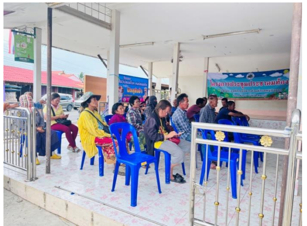
หมู่ที่ ๑๐ บ้านหันตะเภา